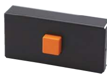
(MCD-D6C押しボタン式変更用) 部品コード(305 0 1000 02100) 希望小売価格 5,000円(税抜)