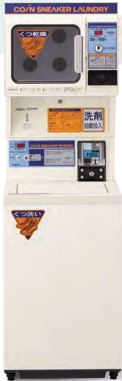
スニーカードライヤー MCD-D6C スニーカーウォッシャー MCW-W6C-5/6 (-5は50Hz、-6は60Hz)

ゴム部や接着部をいためずスピーディに乾燥 シューズハンガーにスニーカーをセットし、コインを入れれば乾燥スタート。低温の温風でゴムや接着部を傷めず乾燥します。