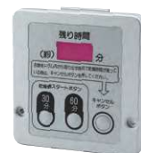
(MCD-CK45押しボタン式変更用) 部品コード(305 0 1000 01900) 希望小売価格 10,000円(税抜)