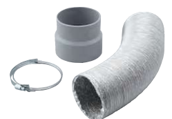
(MCD-CK45、D6C用) 部品コード(305 S 1214 00100) 希望小売価格 6,000円(税抜)

※別売部品の取付けを行なう場合は、別売の「特殊ドライバー」が必要です。(部品コード: S 005900希望小売価格3,500円(税抜)ハイアールジャパンセルス(株)扱い)