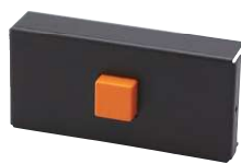
(MCW-C70A、C50A、W6C押しボタン式変更用) 部品コード(301 0 1000 99600) 希望小売価格 5,500円(税抜)