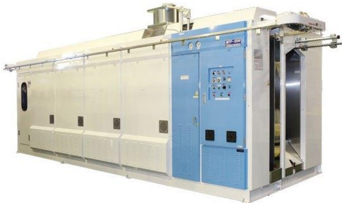
写真は IMTF-1200 です